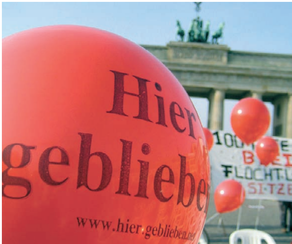
Flüchtlinge demonstrieren 2007 in Berlin für ein Bleiberecht

Beim Thema Bleiberecht sind in den letzten fünf Jahren positive Schritte erfolgt. Doch grundlegende Fragen sind nach wie vor ungelöst. Mit dieser Broschüre zeigen PRO ASYL, Caritas und Diakonie gemeinsam auf, warum die bisherigen Regelungen zu keiner umfassenden Lösung führten. Daraus werden Anforderungen an eine neue Bleiberechtsregelung entwickelt.