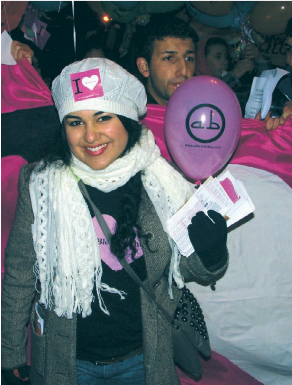
Einsatz der »Jugendliche ohne Grenzen« für das Bleiberecht, Hamburg 2010