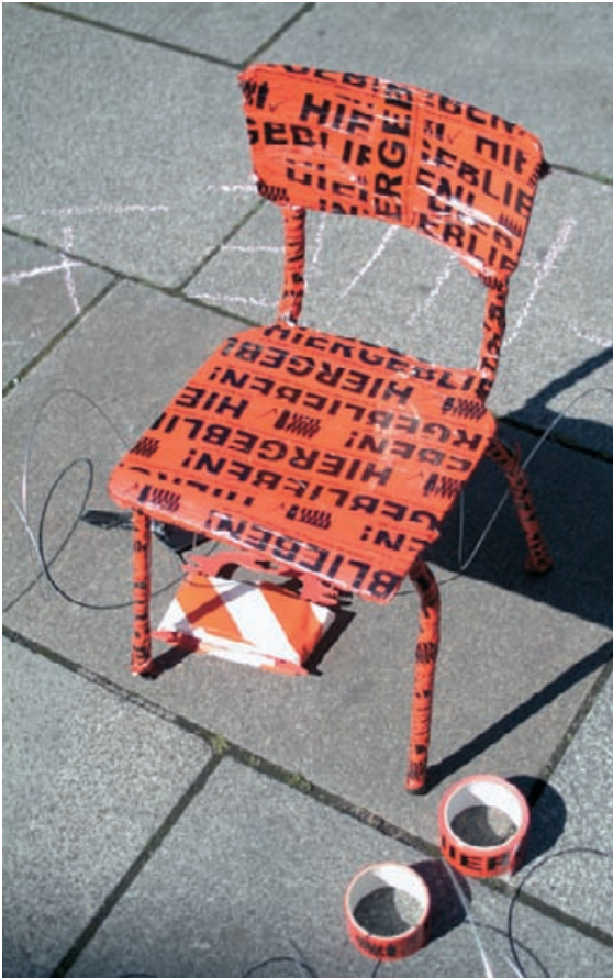
GRIPS Theater Bleiberechts-Aktion 2008 in Berlin

in den folgenden Jahren Jugendliche vom neuen § 25a profitieren könnten. Mit der Beschränkung auf 15- bis 20-Jährige operiert aber auch diese Regelung mit einem altersabhängigen Stichtag: Wer etwa am 1. Juli 2011 sein 21. Lebensjahr schon beendet hatte, kann nicht mehr von der Regelung profitieren. Ein weiteres Hindernis der neuen Regelung werden erneut die Ausschlussgründe darstellen, wie etwa der Vorwurf falscher Angaben über Identität oder Herkunftsland. Das Erfordernis einer guten Integration läuft Gefahr, eng interpretiert zu werden: So sollen nur solche Jugendlichen profitieren, die »erfolgreich« die Schule besuchen und sich »in die hiesigen Lebensverhältnisse dauerhaft vollständig einfügen« werden. Was bedeutet das? Es wirft Fragen auf wie: Darf man einmal sitzen bleiben oder nicht? Welches Maß an jugendtypischen Verfehlungen ist erlaubt? Mit welchen Schulnoten verwirkt man seine Chance auf ein Leben in Deutschland? Wie weniger wohlmeinende Ausländerbehörden diese Frage auslegen können, zeigt das Beispiel eines im Februar 2011 abgeschobenen 15-Jährigen.